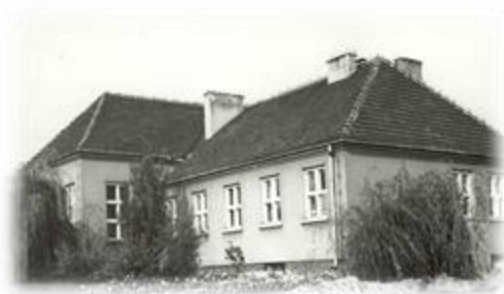
Lecznicza przy ul. Wybickiego 2a

Od roku 1945 lecznica mieściła się w obiektach Rzeźni Miejskiej. Od 1949 roku została przeniesiona na ul. Bernardyńską do obiektów Technikum Weterynaryjnego. W 1954 roku przeniesiona do nowo wybudowanego obiektu przy ul. Wybickiego 2a, od 10.1974 r. mieściła się do prywatyzacji, w nowym obiekcie przy ul. Cieplickiej 5. Obecnie jest siedzibą Powiatowego Inspektoratu Weterynarii oraz prywatnej praktyki weterynaryjnej .